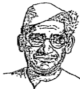
बालकृष्ण शर्मा 'नवीन'

बालकृष्ण शर्मा शाजापुर जिले (मध्य प्रदेश) में अपना गांव छोड़ कानपुर उच्च शिक्षा के लिए गए थे, किन्तु विधि को कुछ और ही मंजूर था। प्रथम असहयोग-आन्दोलन से प्रभावित होकर उन्होंने कालेज छोड़ा और गणेशशंकर विद्यार्थी के सम्पर्क से वह पत्रकारिता और जनसेवा की ओर प्रेरित हुए। एक मासिक पत्रिका का दो वर्ष तक सम्पादन कर उन्होंने 'प्रताप' दैनिक में कार्य आरम्भ किया। अपनी साहित्यिक प्रतिभा, लगन और कांग्रेस-आंदोलन में प्रमुख भाग लेने के कारण कुछ ही वर्षों में बालकृष्णजी की गणना कानपुर के प्रमुख नेताओं में होने लगी। नगर और प्रांत की कांग्रेस-समिति में वह आगे बढ़कर भाग लेने लगे। नागरिक मामलों में, विशेषकर मिल-मजदूरों की समस्याओं में, नवीनजी दिलचस्पी लेते। उच्चकोटि के साहित्यिक और कवि होने के नाते भी उनकी ख्याति फैलने लगी। गणेशशंकर विद्यार्थी के जीवनकाल में ही लोग बालकृष्णजी को उनका उत्तराधिकारी कहने लगे थे। मार्च १९३१ में कानपुर के दंगे में जब विद्यार्थीजी की हत्या हो गई, उसके बाद नवीनजी 'प्रताप' के संपादक और कानपुर के एकछत्र नेता स्वीकार कर लिये गए।